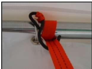
Vue de la panne sous la bâche de toit avec une sangle